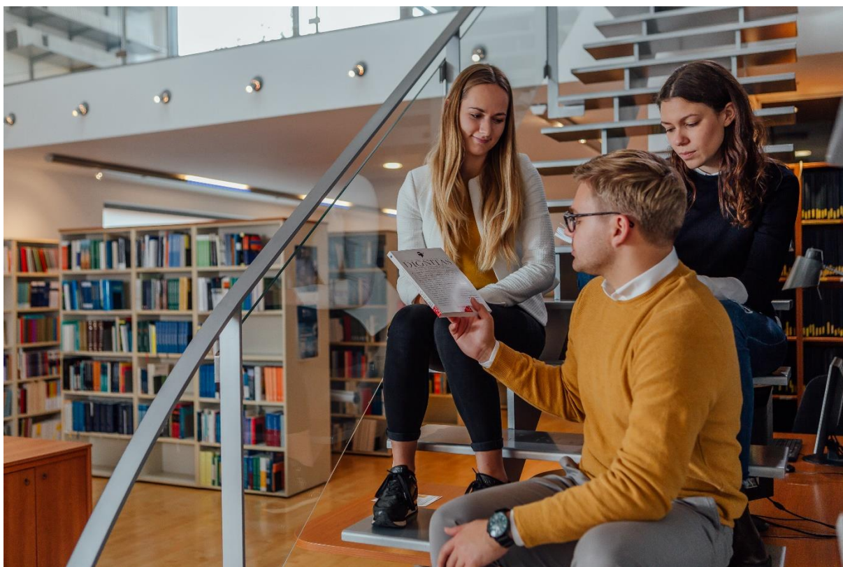
Slika 1: Prostor UKNU

Ustanovitev UKNU in vpis v razvid knjižnic po veljavnem Pravilniku o razvidu knjižnic je bila realizirana dne 19. 6. 2017 z dopisom Narodne in univerzitetne knjižnice št. 6120-31/2017, s katerim je Center za razvoj knjižnic dodelil UKNU naslednjo siglo/evidenčno številko: SI 51018. 14