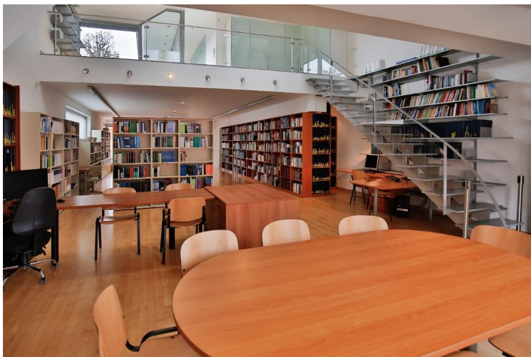
Slika 2: Čitalnica UKNU