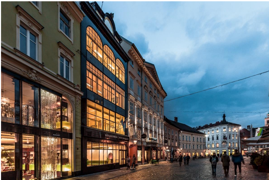
Slika 6: Nova univerza, UKNU v 4. nadstropju