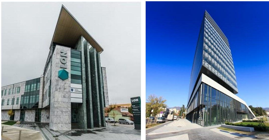
Slika 7 in 8: UKNU Enota Kranj in Enota Nova gorica

Strateški načrt razvoja UKNU je predvideval organizacijo posameznih enot UKNU na lokacijah izvajanja študijskih programov članic NU. V Mariboru v prostorih Inštituta informacijskih znanosti (IZUM) na Prešernovi ulici 17, UKNU v letu 2020 še ni bila organizirana.